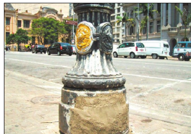
Intervenção deveria ser analisada pelos órgãos de defesa do patrimônio

A medida é extremamente precária. O ideal é a instalação de placas de metal. Creio que há falta do material no estoque.