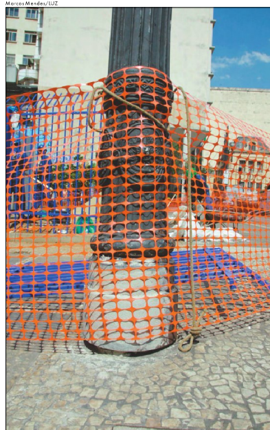
Prefeitura promete substituir o cimento por novas peças de metal

Segundo o mais recente levantamento sobre o tema, o Centro de São Paulo tem 1.560 postes tombados, dos quais cerca de 600 apresentam problemas. Somente no triângulo formado pelos Largos São Bento e São Francisco e pela Praça da Sé, 50 dos 326 postes estariam sem as tampas que protegem a fiação elétrica subterrânea.