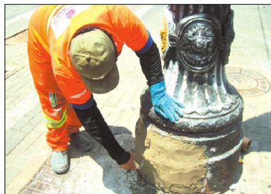
Cimento destoa das peças históricas, confeccionadas em ferro fundido