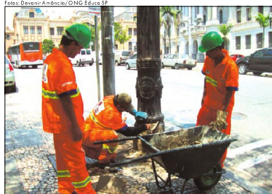
Funcionários realizam o trabalho de concretagem do poste de ferro

Um conhecido personagem da paisagem do Centro Velho de São Paulo recebeu, no início desta semana, uma "benfeitoria", no mínimo, incômodo. Dezenas de postes de ferro fundido datados da década de 1930 receberam camadas generosas de concreto em sua base, para esconder os buracos abertos após a incidência dos constantes furtos da tampa de metal do equipamento público. Estima-se que quase 30 postes tenham sido reformados.